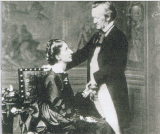
Cosima und Richard Wagner

Voraussichtliche Konzertdauer: ca. 110 Minuten